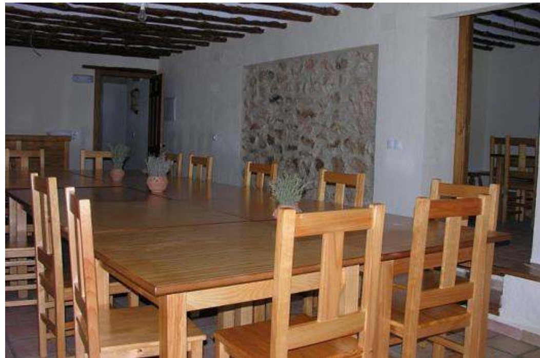
Sala de reuniones de Cortijo Covaroca