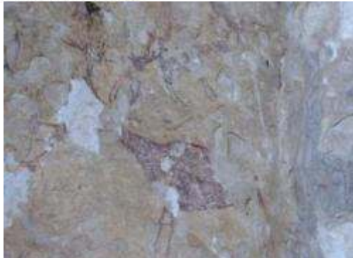
Pintura rupestre de la Solana de las Covachas.