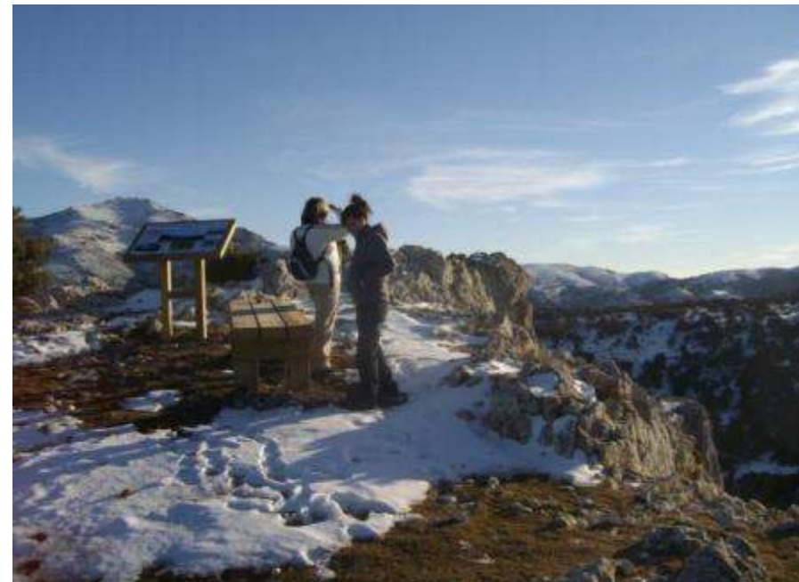
Mirador ornitológico del Puntal de la Vieja.