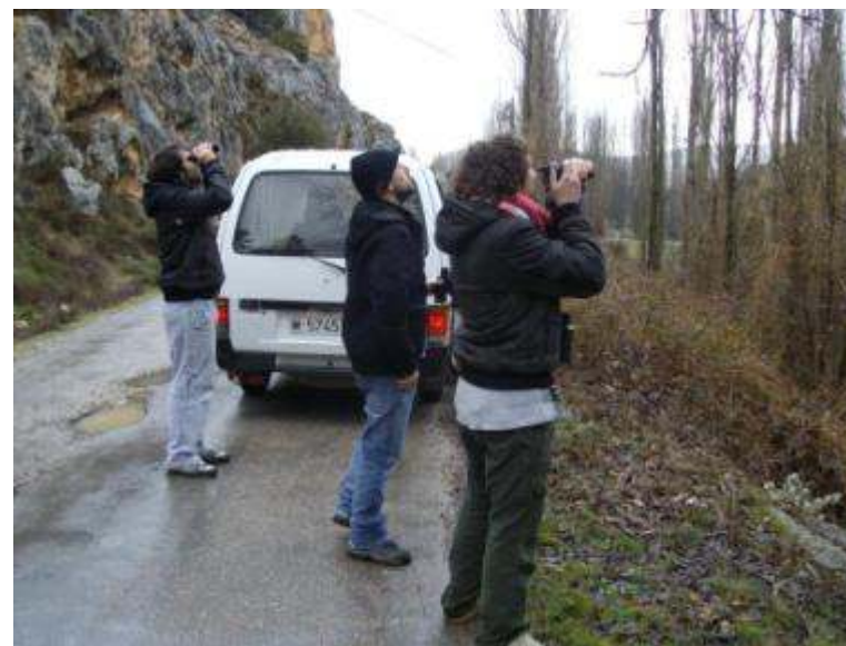
Grupo de estudiantes de turismo observando buitres en el valle del Taibilla.